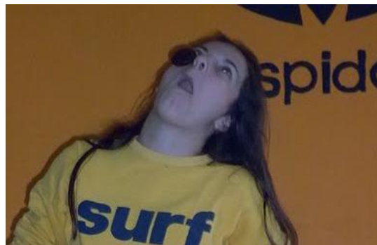
Ik had het niet gedaan