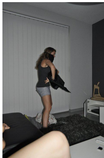
Ellen goes Batman?