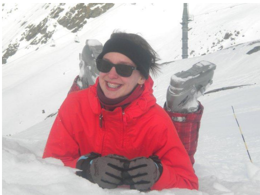
Die welkom-op-mijn-plechtige-communie-blik hoeft niet meer