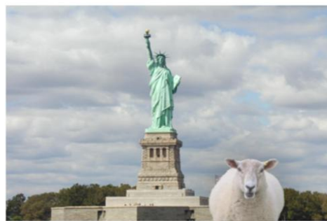
New York 2010