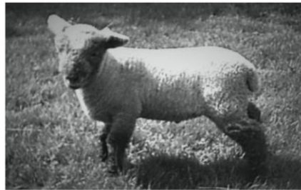
ik op mijn 2 jaar